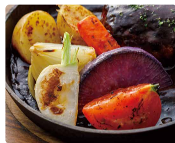
季節のグリル野菜2種